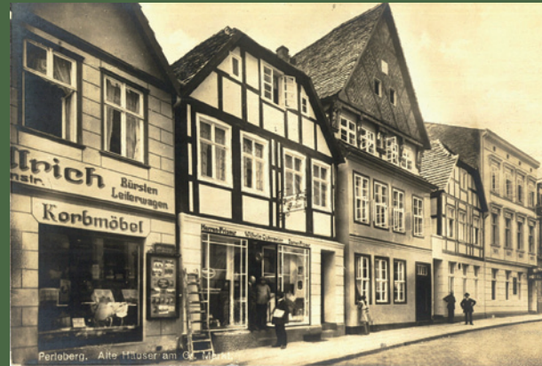
Haus um 1915

Nicht nur seine Familiengröße mit 12 Kindern, sondern auch seine ausgezeichneten Waren wie Hafergrütze, Buchweizengrütze und Haferschleimmehl sind erwähnenswert. Aber wer weiß es schon: Ludwig Wolff gilt als der Erfinder der Haferflocken, indem er durch das Quetschen der Körner ein neues Produkt herstellte.