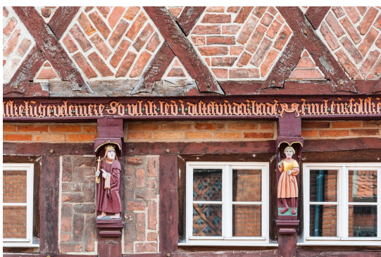
Das Knaggenhaus in Perleberg