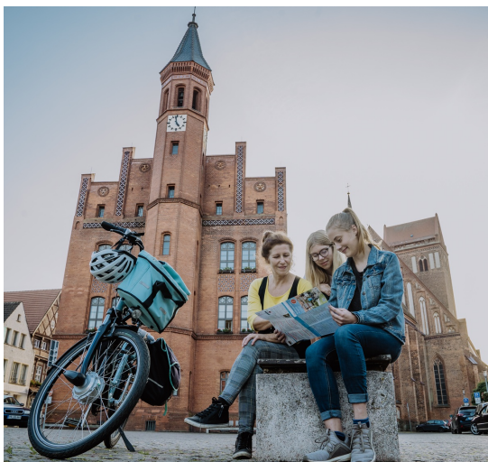
Radfahrer auf dem Großen Markt mit Blick auf das Rathaus und die St. Jakobi-Kirche

Der Brandenburg-Tag ist ein Fest - aber Perleberg ist mehr als ein Wochenende voller Bühnen, Stände und Musik. Zwischen den alten Mauern, an den Ufern der Stepenitz und in den kleinen Gassen wartet das, was bleibt: Geschichten, Begegnungen und Lieblingsplätze, die sich erst zeigen, wenn der Trubel vorbei ist. Weil die schönsten Entdeckungen oft beim zweiten Blick warten.