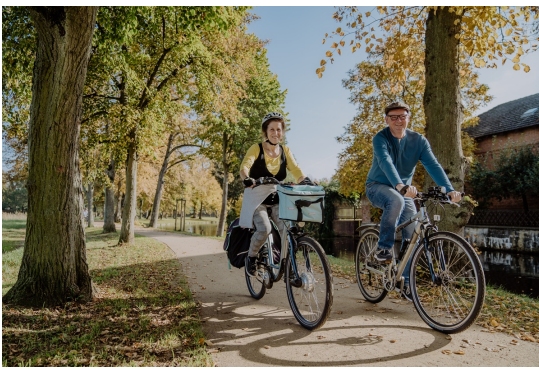
Radfahrer an der Stepenitz in der Rolandstadt Perleberg